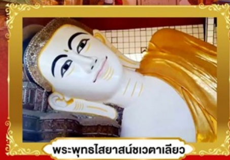
พระพุทธรูปไสยาสน์ชเวตาเลียว