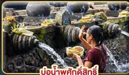
บ่อน้ำพุศักดิ์สิทธิ์