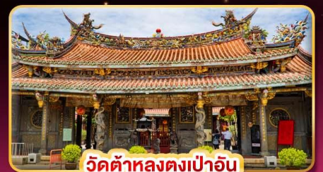
วัดต้าหลงตงเปาอัน