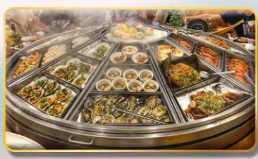
หม้อนึ่งจักรพรรดิ