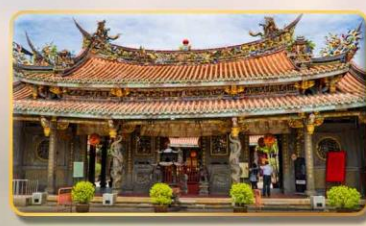
วัดต้าหลงตงเป่าอัน