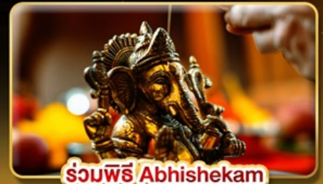
ร่วมพิธี Abhishekam