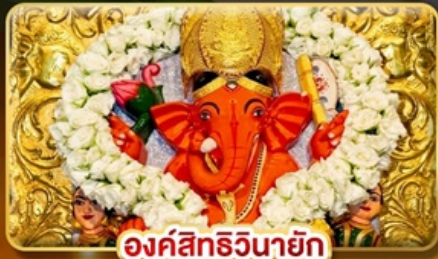
องค์สิทธินายก