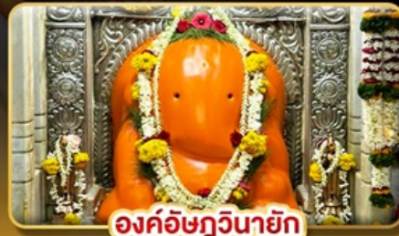
องค์อชฏวินายก