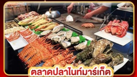
ตลาดปลาไนท์มาร์เก็ต