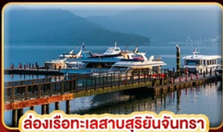
ล่องเรือทะเลสาบสุริยอันจนรา

บินเต็ม STREET FOOD แบบจุใจ ขอความรักวัดแดงชาน