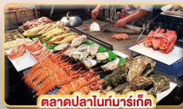
ตลาดปลาโน้ทมาร์เก็ต