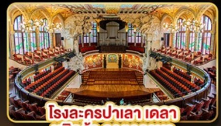
โรงละครปาลาเดอรา มูสิคก้า คาทาลานา