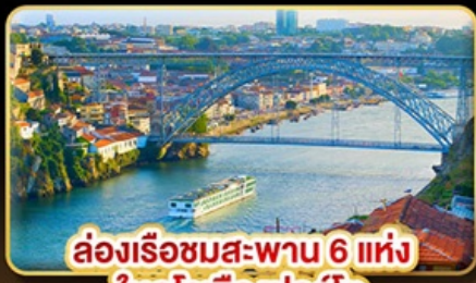
ล่องเรือชมสะพาน 6 แห่ง ในคูโรเมืองปอร์โต