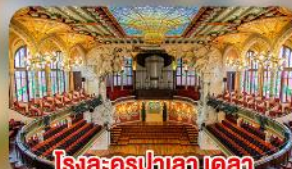
โรงละครปาลเล เดลา มูสิคก้า คาตาลานา