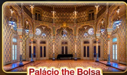
Palácio the Bolsa