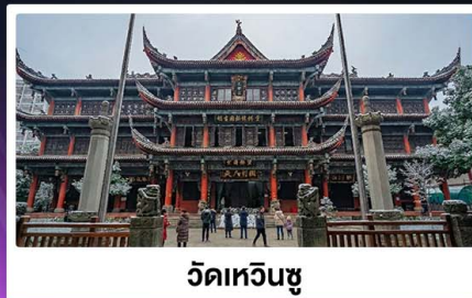
วัดเหวินซู