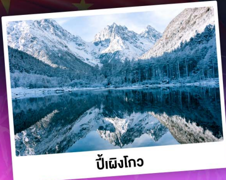
ป่าเผิงโกว

ท่องเขาแอลป์เมืองจีน "ภูเขาสี่ดรุณี" ชมความสวยงามของอุทยานป่าเผิงโกว