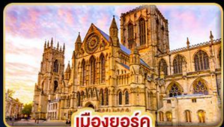
เมืองยอร์ก