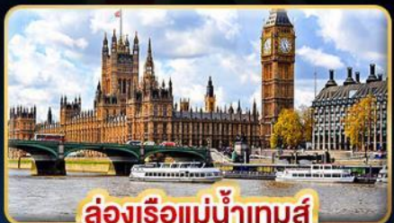
ล่องเรือแม่น้ำเทมส์