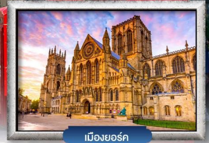
เมืองยอร์ก