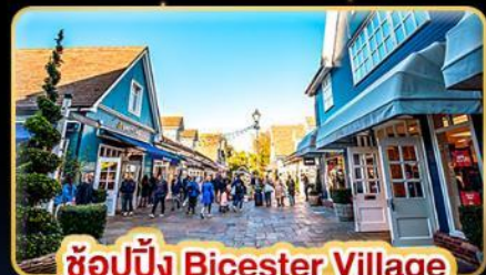
ช้อปปิ้ง Bicester Village