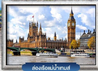
ล่องเรือแม่น้ำเทมส์