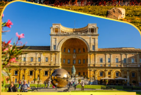
เข้าชมพีพีรภัณฑทวาตักัน