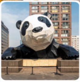
หมีแพนด้ายักษ์ป็นตึก