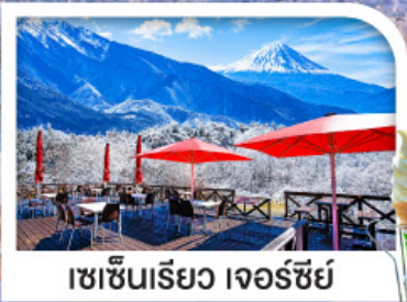
เซชินเรียว เจอร์ซีย์

หมู่บ้านมรดกโลกชิราคาวาโกะ | ชมวิวฟูจิ ริมทะเลสาบคาวากูจิ เซชินเรียว เจอร์ซีย์ ระเบียงชมวิวภูเขาไฟฟูจิและเทือกเขาแอลป์