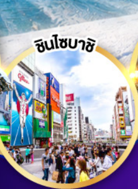
ชินโซฮาชิ