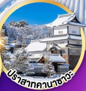
ปราสาทคานาซาวะ