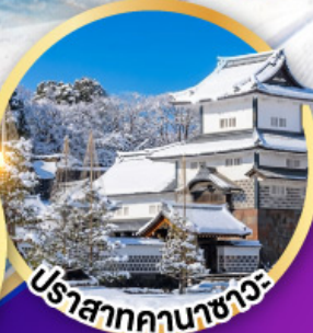
ปราสาทคานาซาว่า