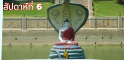
สระมัจฉิณทร์ (จำลอง)