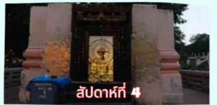
รัตนขรเจดีย์ (ซุ้มเรือนแก้ว)

เรียบร้อยแล้ว นำคณะจาริกบุญสวดมนต์ทำวัตรเย็น บูชาพระรัตนตรัย และสวดมนต์บูชาสังเวชนียสถาน จากนั้นเชิญท่านทำศนาธรรม นั่งสมาธิปฏิบัติบูชาตามอัยาศัย สมควรแก่เวลา นัดหมายเวลาเชิญท่านกลับโรงแรมที่พัก