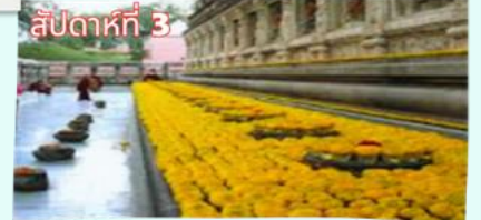
รัตนองกรมเจดีย์