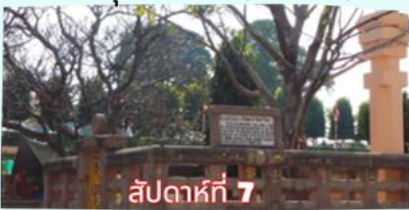
ราชายณะ (จำลอง)