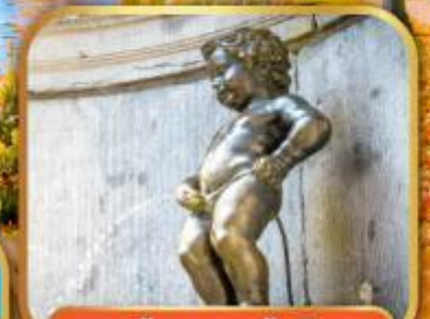
ทูน้อยมานเทินพิส