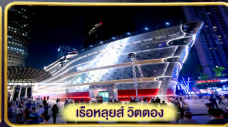
เรือหลุยส์ วิตตอง