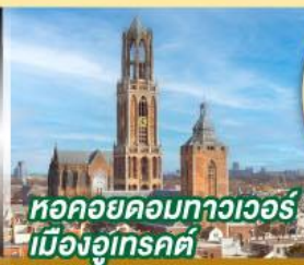
หอคอยคอมพิวเตอร์ เมืองอูเทรคต์