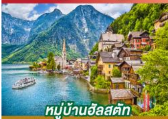
หมู่บ้านอัลสตัด