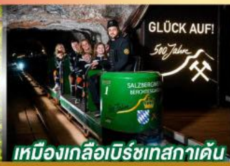
เหมืองเกลือเบิร์ชเทสกาเดิน