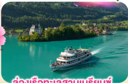
ล่องเรือทะเลสาบเบรียนซ์

พิชิตยอดเขาชุนเนกกา 1 ในเขาที่สวยงามที่สุดเมืองเซอร์แมท