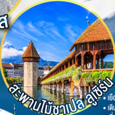
สะพานไม้ชาเปลลูเซิร์น