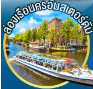
ล่องเรือนครอัมสเตอร์ดัม