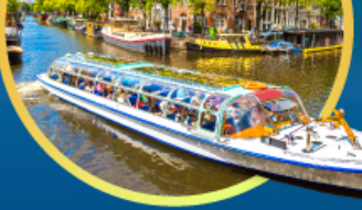
ล่องเรือนครอัมสเตอร์ดัม