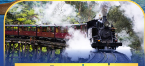
รถไฟฟฟิงบิลลี่

ล่องเรือชมอ่าวซิดนีย์พร้อมรับประทานอาหารกลางวัน และ เข้าชมสวนสัตว์การองก้า