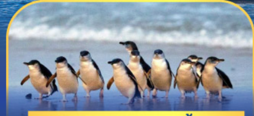
พาหระดนกเพนกวิน