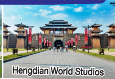
Hengdian World Studios