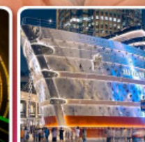
เรือหลุยส์