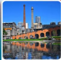
Eastern Suburb Memory Chengdu