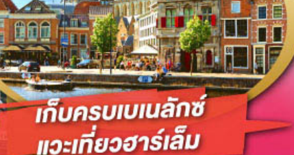
เก็บครบเบเนลักซ์ แะเที่ยวฮาร์เล็ม