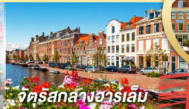
จัตุรัสกลางฮาร์เล็ม