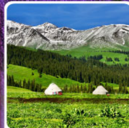
ทุ่งหญ้านาฬิกา