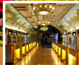
พิพิธภัณฑ์ไวน์ชิงเต่า