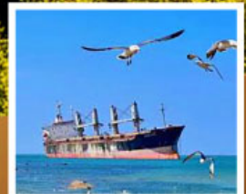
เรือสินค้ากายนตันบลูวิส