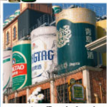
พิพิธภัณฑ์โรงเบียร์ชิงเต่า