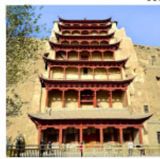
ถ้ำม่อเกา