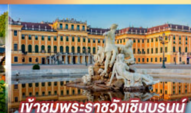
เข้าชมพระราชวังฮินบรุนน์