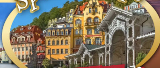
ชมสถาปัตยกรรมคลาสสิก เมือง คาร์โลวี วารี