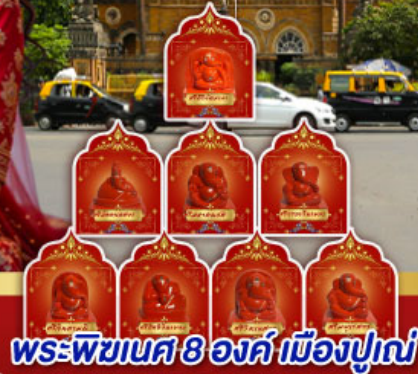
พระพิฆเนศ 8 องค์ เมืองปูณ

" อินเดียครั้งนี้ ไม่ใช่แคทริป แต่คือการเปลี่ยนแปลง ปลุกพลังในตัวคุณ... ด้วยพิธีกรรมศักดิ์สิทธิ์ ณ สถานที่จริง ของพระพิฆเนศ ดินแดนแห่งปัญญาและพรสูงสุด"