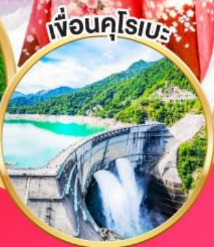
เพื่อนคูโรเบะ