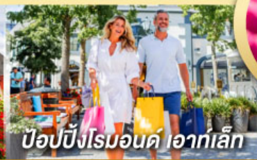
ป๊อปบิงโรมอนด์ ไอเกิ้ล