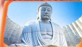
นินพระพุทธรเจ้า