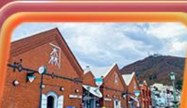
โถงอิฐแดง

✈️ สายการบิน Thai Airways (TG) น้ำหนักกระเป๋า 23 KG