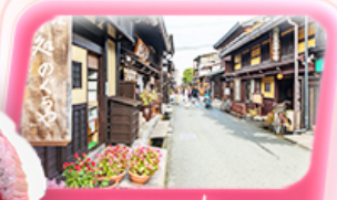
ทาคายามา