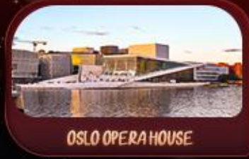
OSLO OPERA HOUSE

รหัสโปรแกรม : SEK156 9วัน 6คืน เที่ยวบินโฮล์ม-ออกโคเปนเฮเกน