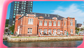
มิซึโกะ เรโทร