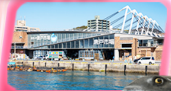
KARATO FISH MARKET