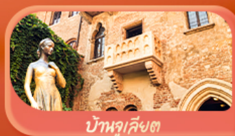
บ้านลูเลียง