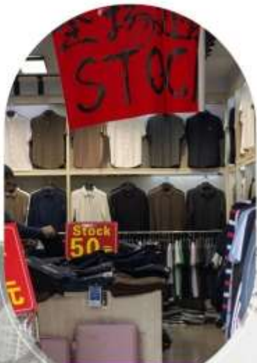
ตลาดค้าส่งอู่