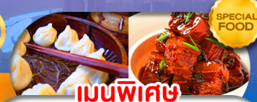
เมนูพิเศษ เสี่ยวหลงเปา หมูน้ำแดง เดินทาง ต.ค. 69 - มี.ค. 70