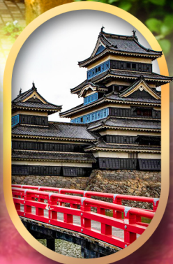
ปราสาทคามาโมโตะ