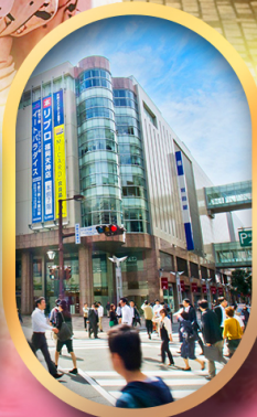
ช้อปปิ้งย่านเท็นจิน