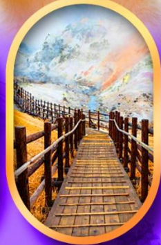
หุบเขานรกจิงคุดานิ