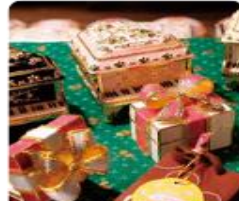
กล่องดนตรี MUSIC BOX