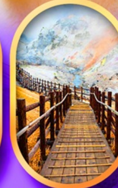
จิกุคคาบิ