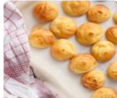
ร้าน KITAKARO ยังมีเมนูขนมจากตาลตาลๆ ไร้แป้ง ไร้ไขมันและเป็นวีแกนอีกด้วย และเมนูที่จะคือของฝากเป็นของว่าดี