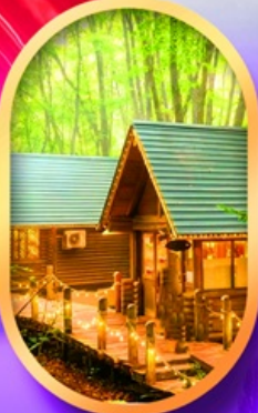
นิงเกิลเกอเรน