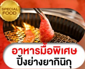
อาหารมือพิเศษ ปิ้งย่างยากินิกุ