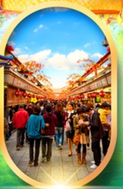
ถนนนากามิสะ