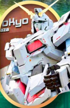
ห้างไอโดะกันดั้ม