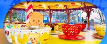
Fuji q Highland x Butterbear เดินทาง พ.ค. 69 เป็นต้นไป