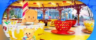
Fuji Q Highland x Butterbear เดินทาง พ.ศ. 69 เป็นต้นไป