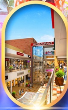
มิตซุยอาก้าเกิ้ลิต