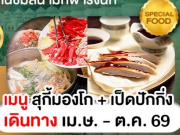
เมนูสุกั่มองโก + เปิดปักกิ่ง เดินทาง เม.ษ. - ต.ค. 69