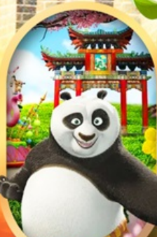
OPTION Universal Studios