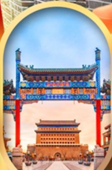
ถนนคนเดินเจียนเหมิน