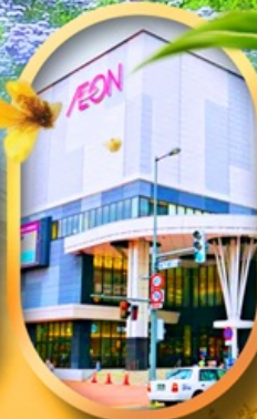
อีออนมอลล์