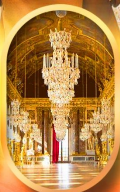
พระราชวังแวกทิกัน