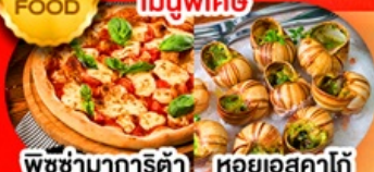
พิซซ่ามาการิตต้า หอยยอสคาโก้