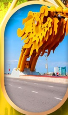
สะพานมังกรดามัง