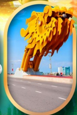
สะพานมังกรดานัง