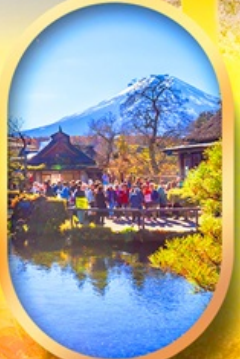
หมู่บ้านน้ำใส