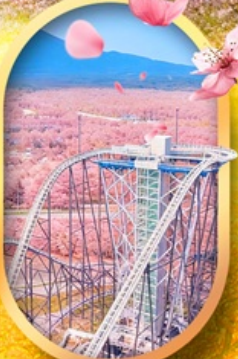
ฟูจิยาม่า ทาวเวอร์