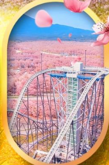
ฟูจิยาม่า ทาวเวอร์